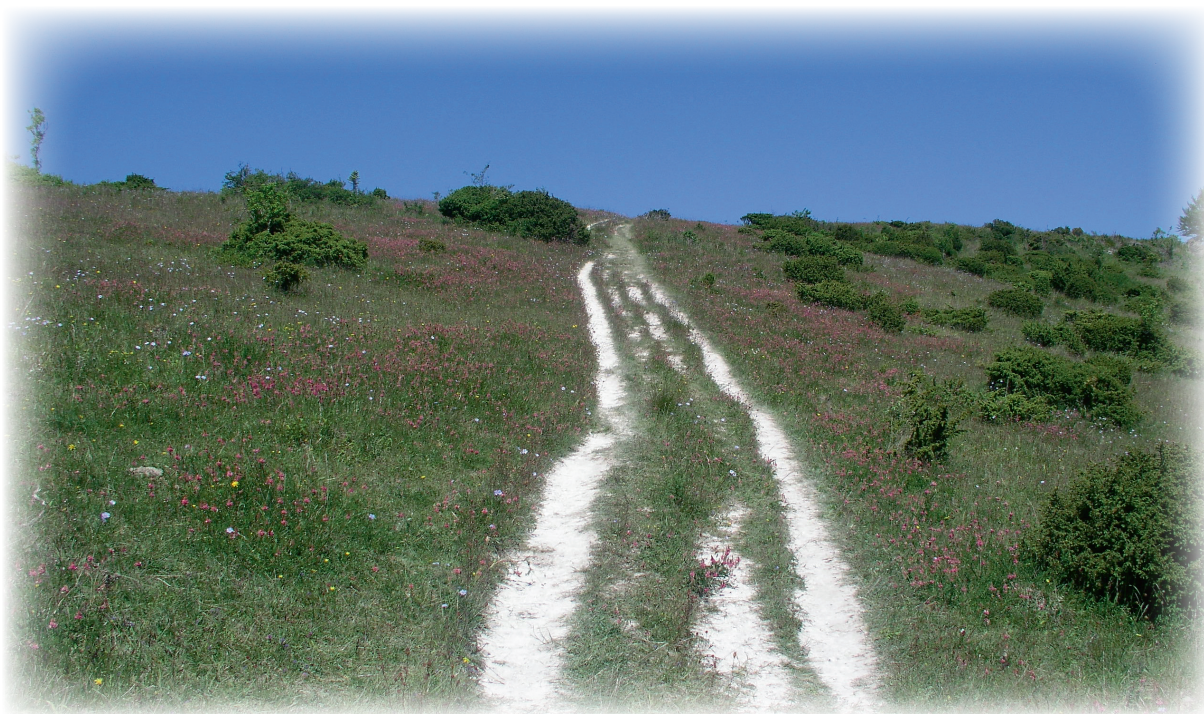
Møn: Høvblege, Kridtstien mod Kongsbjerg

Tænkebænken på forsiden er placeret på Kongsbjerg på Høvblege, der ligger syd for Klinteskoven på Møns Klint. Bænken står placeret på toppen af Overdrevet og 135 meter over havets overflade. Herfra er der en formidabel udsigt ud over Østersøen. I klart vejr kan man se til det gamle DDR og Rügen.