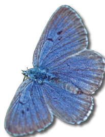
Møn, Høvblege Sortpletet Blåfugl, meget sjælden

I hear a very gentle sound Very near, yet very far very soft, yet very clear Come today, come today (...)